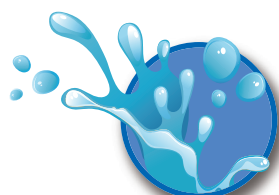
アストロ給湿液シリーズ Astro Fountain Solution Series