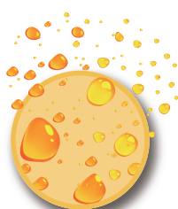
水棒洗浄剤シリーズ Dampening Roller Cleaner Series