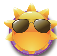
日研化学のUV用製品 NIKKEN Products For UV Printing